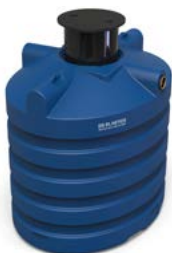
1. 6923 DS6000 Cuve eau de pluie 6000l premium