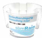
3. 7076 Ralentisseur à l'entrée