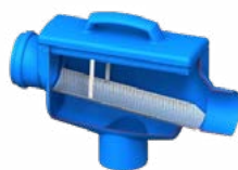
2. 6817 Filtre eau de pluie Slim rain it