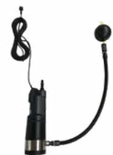
5. 9040 + 7088 Pompes immergées automatiques divertron 900 x avec filtre d'aspiration et tuyau d'aspiration 0.75m